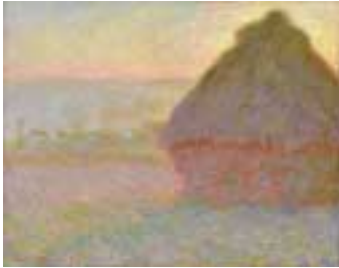
《積雲、日没》1891年 Juliana Cheney Edwards Collection 25.112