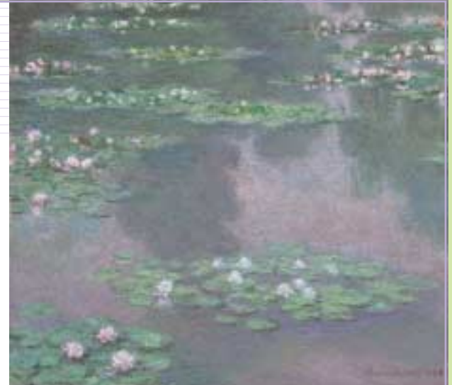
《睡蓮》1905年 Gift of Edward Jackson Holmes 39.804