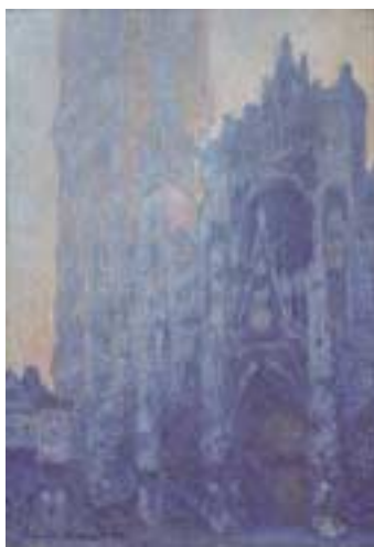
《ルーアン大聖堂、正面とアルバヌス(朝の効果)》1894年 Tompkins Collection-Arthur Gordon Tompkins Fund, 24.6